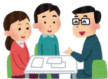
デイ・ケアスタッフと面談