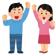
各コースで活動開始