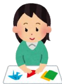
活動を体験してみましょう